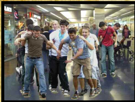
On gagne en planche à skis

Pour des épreuves ludiques seul, en famille ou en équipe... Défendez vos couleurs !