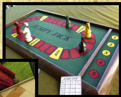
Jumpy Jack (Irlande du Nord)