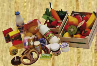
Eléments de cuisine...

Je vais au marché du village et avec les produits de saison je cuisine comme un petit gastromome, j'apprends à composer les menus... et j'invite au restaurant mes amis et mes parents. Accueil sur 100 m 2 40 enfants