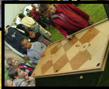
Billard Bil Dom (Pays de Galles)