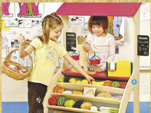
Je commence par faire les courses

Je vais au marché du village et avec les produits de saison je cuisine comme un petit gastromome, j'apprends à composer les menus... et j'invite au restaurant mes amis et mes parents. Accueil sur 100 m 2 40 enfants