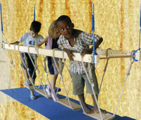
...à la Réalisation