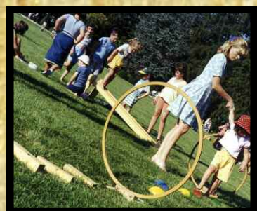
On chemine sur le parcours