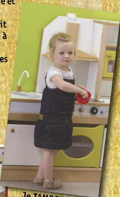
Je TAMBOUILLE !...