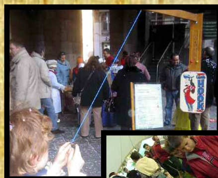
Capitaine Hook (Angleterre)

Toute une panoplie de jeux du Royaume Uni !