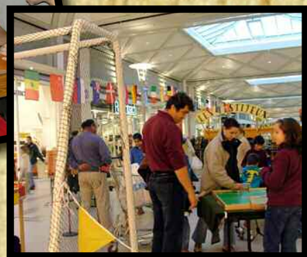
Décors, drapeaux cages de foot