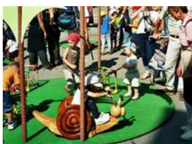
Escargot bascule (France 19 è )

Jeu de balançoire. Magnifique, objet tout en bois pour accueillir les bambins de 2 à 5 ans. 1 joueur à tour de rôle. 80 cm de long x 70cm de haut. Extérieur/Intérieur. A son propre support.