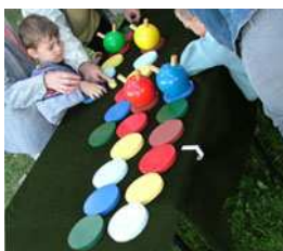
Course de Chenilles (Allemagne 20 è )

Jeu de course et de déplacement avec beaucoup de couleurs et des têtes de chenilles figuratives. La chenille se déplace sur des disques de couleur selon le score du dé. Disque de 15cm de diamètre, chenille de 15 cm de hauteur. De 1 à 6 joueurs à partir de 3 ans. Extérieur/Intérieur. A poser sur une table