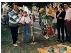
Grenouille (Espagne 17 è )

Jeu d'adresse. Jeu traditionnel très référencé. 80cm de haut. Lancer de palets dans des orifices de valeur différente dont la bouche de la grenouille est le maximum. Tout public. Un joueur à tour de rôle. Extérieur/Intérieur. Propre support