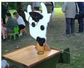
Vache aux Anneaux (Angleterre 19 è )

Jeu de lancer et d'adresse. 1 joueur à tour de rôle lance des anneaux sur les cornes, le nez, les oreilles d'un taureau pour marquer des points, mais 1 joueur adverse peut manipuler le taureau avec une ficelle, le bouger en même temps. A partir de 4 ans. Extérieur - Intérieur. A son propre support.