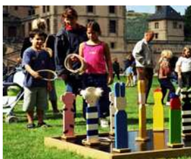
Capture des Animaux (France 20 è )

Jeu d'adresse. Création originale et figurative à partir du jeu d'anneaux anglais. Lancés d'anneaux sur des bâtonnets posés sur un socle de bois de 5m 2 . Tout public à partir de 4 ans. De 1 à 9 joueurs. Extérieur/Intérieur. A son propre support.