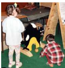
Trou du chat (Bretagne 18 è )

Jeu d'adresse d'inspiration bretonne d'1m de hauteur. On lance une boule à travers les pattes d'un chat en bois et on recule d'un mètre à chaque coup réussi. Un joueur à tour de rôle. Extérieur/Intérieur. Propre support.