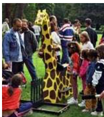
Girafe à la Pêche (Espagne 20 è )

Jeu de manipulation et d'adresse. Assis à califourchon sur le dos d'une girafe en ferraille, colorée, le joueur déplace la tête avec un système de manivelles pour attraper avec un aimant des buissons dans un jardin de décor spectaculaire s'adressant plutôt aux jeunes enfants. 1m 70 de hauteur. De 2 à 12 ans. Extérieur/Intérieur. A son propre support.