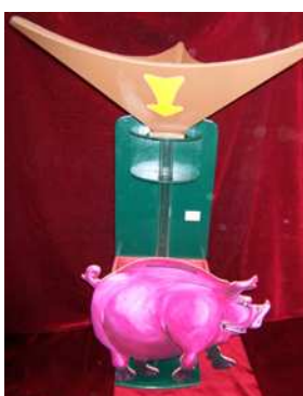
Cochon tire Bouchon (France-Isère 21 è )

Jeu de lancer et d'adresse. Création labellisée les FestijeuX de ce bel ouvrage coloré de 1m50 de hauteur x 70cm de large, à la fois objet de jeu et d'attrait visuel avec le mouvement du bouchon dans le goulot. Extérieur/ Intérieur. Tout public. 1 joueur à tour de rôle. A son Propre support.