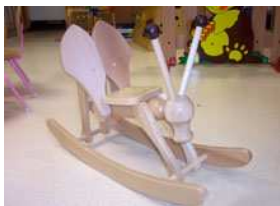
Sauterelle (France 19 è )

Jouet en bois comme à l'ancienne. Jeu de balançoire sculpté symbolisant une sauterelle. 1 personne à tour de rôle. 1m 60 sur 0m60 de hauteur. Tout public à partir de 2 ans. Intérieur/ Extérieur. A son propre support.