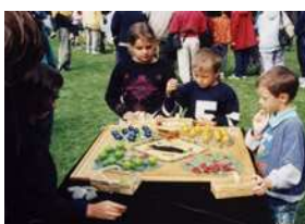
Verger Géant (Allemagne 20 è )

Jeu de coopération. Adaptation en surdimensionné de ce mythique jeu de coopération. Très beau plateau peint à la main de 0,70 m x 0,70 m. De 1 à 4 joueurs. Tout public à partir de 3 ans. Tous les fermiers récoltent les fruits ensemble avant l'apparition du corbeau. Extérieur/Intérieur. A poser sur une table.